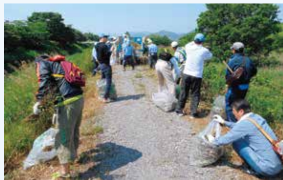
[2017年5月20日] 静岡市流通センター付近の清掃活動