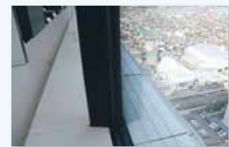
深い庇による日射遮蔽