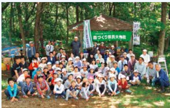
[2017年5月28日] 伊豆の国市田中山県営林の里山づくり

2017年度末の会員数は、企業・団体・学校・個人合計で27,643人、このうち静岡銀行グループの会員は6,403人と、多くの従業員が活動に参加しています。