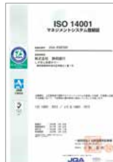
ISO14001 マネジメント システム登録証